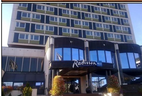
Radisson Blu Caledonien Hotel