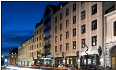
Rica Hotel Norge

Lagene innkvarteres på gode hoteller i sentrum av Kristiansand. Primært vil vi benytte følgende hoteller.