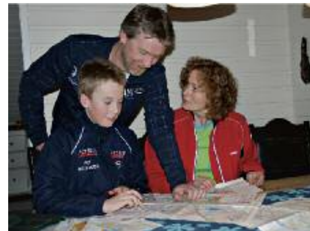
Familien Tønsberg forbereder seg til årets sesong.

Han er imponert over de mange løypene å velge i på treningsløpene. I fjor fikk familien med seg et par store løp også. Den elektroniske tidtakingen som gjør at man kan få se tiden sin mellom hver post, og sammenligne med de andre, gjør det ekstra spennende.